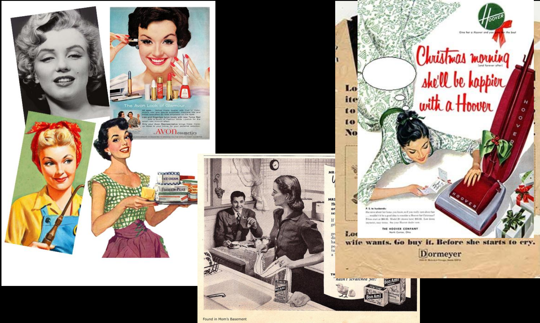
Found in Mom's Basement