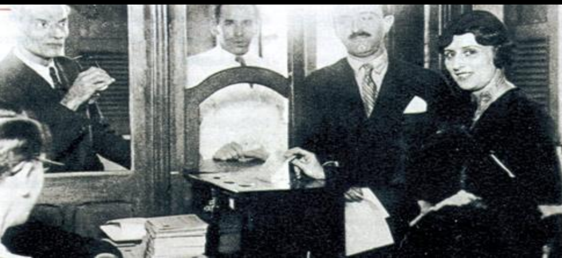
Centro de Memoria/TSE